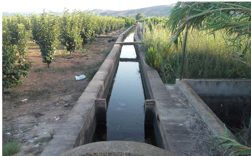
Braçal Canal de Pedra

Una vegada escripturada la redempció del senyoriu d'Antella, l'Ajuntament d'Antella, compost pels emfiteutes que han obtingut la redempció del senyoriu, es faran càrrec del govern de la Sèquia Particular i del monte que servirà per a obtenir ingressos per a l'ajuntament a través de les subhastes de la llenya i de les pastures dels ramats. Esta extinció, previ pagament al Comte de Ròtova d'una quantitat estipulada en el document transaccional, suposava que la Baronia quedava com a títol honorífic en la persona o descendents del Comte però ja sense conseqüències pràctiques sobre els seus drets feudals sobre el poble d'Antella.