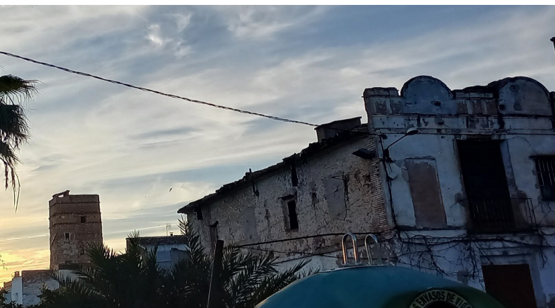
Vista de la Torre des del moli

"a moldre en lo moli del senyor, coure en lo forn, fer oli en la almàssera, comprar en la tenda, taverna fleca y carnisseria del dit lloc..."